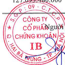
Ngô Phương Chí Chủ tịch Hội đồng Quản trị