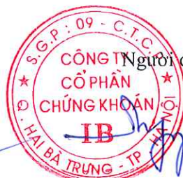
Ngô Phương Chí Chủ tịch Hội đồng Quản trị