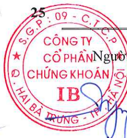
Ngô Phương Chí Chủ tịch Hội đồng Quản trị