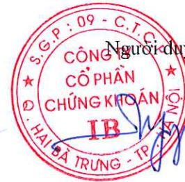
Ngô Phương Chí Chủ tịch Hội đồng Quản trị